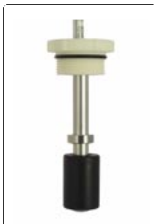
■ TRS 130 Bestell-Nr.: 6 6011 7102

Tankgeber für Fäkalientanks zur 3/4 Voll-Meldung gemäß der Fäkalientankverordnung. Vollmeldung bei Füllstand 80 mm vor Erreichen der Tankoberkante. Ideal für Tanktiefen 200 - 400 mm. Geberlänge 120 mm. Lieferung mit Flansch und Dichtung.