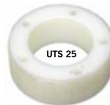
Abstandsring zum Ausgleich der Totzone