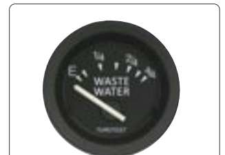
Waste UTU Nr.: 2 0778 2041

Anzeigedisplay passend zu Ultraschallgeber UTV. Geeignet für 12 V und 24 V.