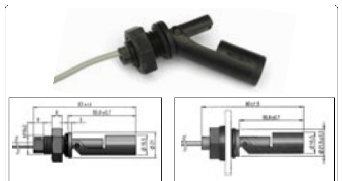
■ RSW Bestell-Nr.: 0 8930 0008

Schwimmerschalter für den seitlichen Einbau in Tanks zur Pegelerfassung. Je nach Einbaulage öffnet oder schließt der Schalter bei ansteigendem oder sinkendem Füllstand. Das Gehäuse ist aus Polyamid schwarz, für Öl und Benzin geeignet. Montage von innen nach außen. Schaltstrom max. 0,5 A