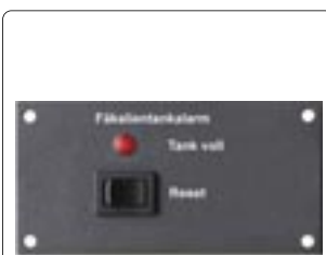
■ FAF -12V Bestell-Nr.: 0 2801 1020 ■ FAF -24V Bestell-Nr.: 0 2802 1020

Tankgeber für Fäkalientanks zur 3/4 Voll-Meldung gemäß der Fäkalientankverordnung. Vollmeldung bei Füllstand 80 mm vor Erreichen der Tankoberkante. Ideal für Tanktiefen 200 - 400 mm. Geberlänge 120 mm. Lieferung mit Flansch und Dichtung.