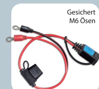
Gesichert M6 Ösen