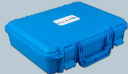
Transportbox für Ladegeräte und Zubehör