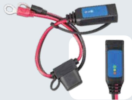
Batterie Anzeige M8 Ösen