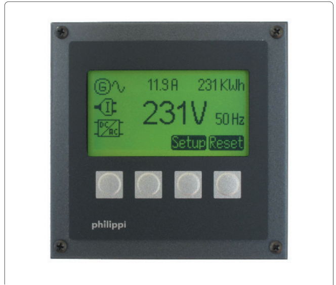
■ ACM 3 Bestell-Nr.: 0 7000 2330

AC-Monitor zur Überwachung des Wechselspannungs-Systems. Einbaugerät. Lieferung inklusive Verbindungskabel zum Messwandler ACW 65-3, Länge 5m. Messwandler ACW 65-3 bitte separat bestellen.